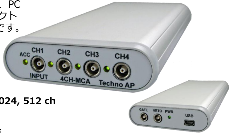
APG7400A USB-MCA 4 (上図：前面, 下図：背面)

各チャンネルに高速逐次比較型ADCを搭載し、PCからのUSBバスパワーで動作する軽量コンパクトかつリストモードも可能な4チャンネルMCAです。