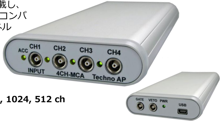
APG7400A USB-MCA 4 (上図：前面, 下図：背面)