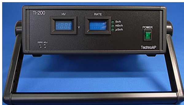
TI-200 前面パネル ※ハンドルを立てた状態