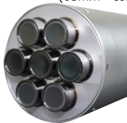
検出器面拡大写真