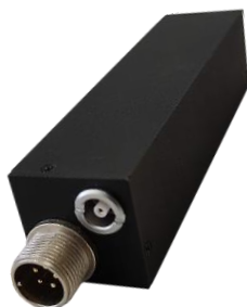
半導体検出器用チャージアンプ APG1603