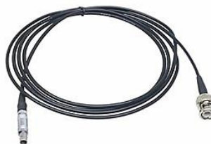
CBL-BNC-LEMO-5M BNCコネクタとLEMOコネクタ